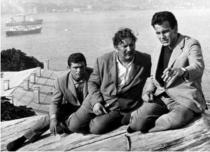
Jules Dassin TOPKAPI, USA 1964

Geld oder Leben! (1) Die Coen Brothers (2) Roberto Rossellini zum 100. Geburtstag (3) Portrait Michael Powell 60 Jahre Spanischer Bürgerkrieg