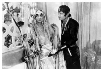
THE THIEF OF BAGDAD, USA 1940

THE THIEF OF BAGDAD (1940) ist ein opulent ausgestatteter Märchenfilm, für den Produzent Alexander Korda insgesamt sechs Regisseure beauftragte und keine Kosten scheute. Seine Version gilt als eine der phantasievollsten, die Generationen von Kindern begeisterte, die sich besonders mit dem jungen Darsteller des Diebes, Sabu, identifizierten. Der Großwesir Jaffa hält den Prinzen Ahmed im Kerker seiner Burg gefangen, der sich jedoch mit Hilfe des Diebes Abu befreien kann. Zusammen bestehen sie eine Reihe von Abenteuern, um zu verhindern, dass der Großwesir die Prinzessin heiratet, in die sich Prinz Ahmed verliebt hat.