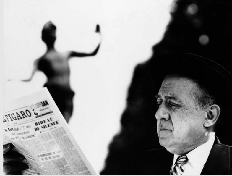
Rideau de Silence, Paris (1957)

Die Literatur-Verfilmung DIE EROBERUNG DER ZITADELLE (1977) erzählt, wie sich die Weltansicht eines Mannes verändert. Ein deutscher Intellektueller lernt als unwillkommener Gastarbeiter in Italien,