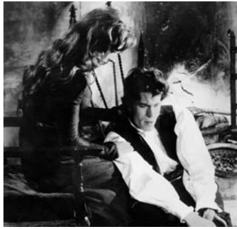
VANINA VANINI, Italien/Frankreich 1961

Mit THE LADYKILLERS (2004) drehen die Coen Brothers ein Remake der gleichnamigen britischen Komödie von 1955, in der sich der Anführer einer Gaunerbande bei einer alten Dame einquartiert; vorgeblich macht er mit seinen Komplizen Musik, in Wahrheit bereitet er einen Raub vor. Die Coen Brothers verlegten die Geschichte in ein gänzlich anderes Milieu: eine Kleinstadt in Mississippi – allerdings eine vollkommen künstliche, in der die Cartoon-artigen Figuren, die sie entworfen haben, funktionieren. Die Gospel-Musik auf der Tonspur steuerte wieder T Bone Burnett bei.