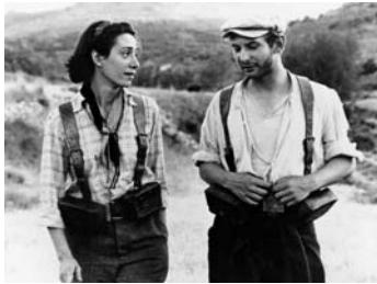
LAND AND FREEDOM, GB/Spanien/D 1995