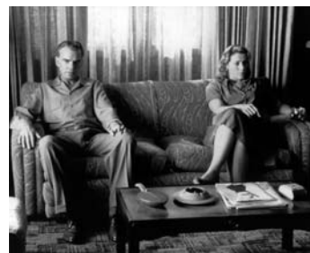
THE MAN WHO WASN'T THERE, USA 2001

Der Dude, mit richtigem Namen Lebowski, ist ein Alt-Hippie in Los Angeles, dessen Hauptbeschäftigung im täglichen Bowling mit seinem Freund Walter, einem durchgeknallten Vietnamveteranen, besteht – bis er eines Tages von Geldeintreibern mit einem Multimillionär gleichen Namens verwechselt und daraufhin in einen Entführungsfall mit Lösegeldübergabe verwickelt wird, in dessen Verlauf sich die absurden Ereignisse überschlagen. THE BIG LEBOWSKI (1998) nimmt seine Ausgangssituation aus dem Detektivfilm, wartet aber auch darüber hinaus mit einer Fülle filmischer Zitate und ironischer Anspielungen auf, die zusammen keinen logischen Handlungsstrang, aber dafür etwas wirklich aufregend Neues ergeben. O BROTHER, WHERE ART THOU? ist der Titel des sozial engagierten Films über das Leben der Armen, den der Hollywood-Regisseur John L. Sullivan in Preston Sturges' Komödie SULLIVAN'S TRAVELS von 1942 endlich drehen will – nach leidvollen Erfahrungen macht er statt